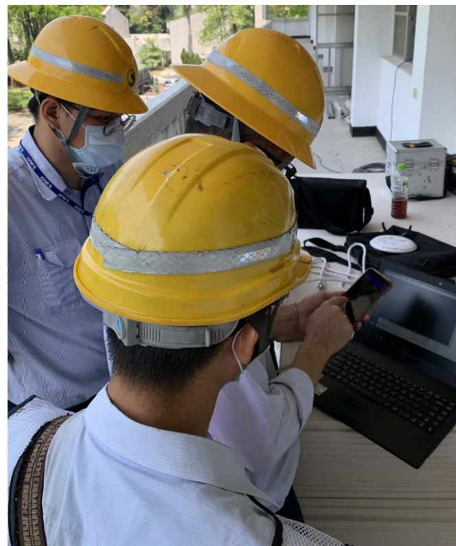
實地勘察用戶觀察其行動網路速率與涵蓋分布