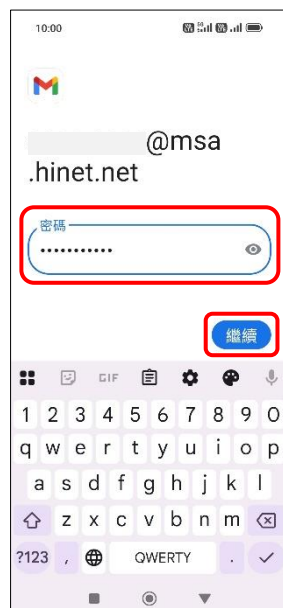
8.輸入郵件密碼→繼續