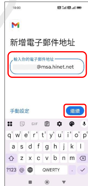
6.新增電子郵件地址 →繼續