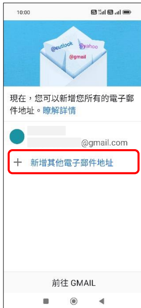
4.+新增其他電子郵件地址