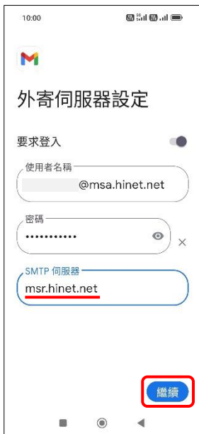
10.外寄伺服器設定→繼續