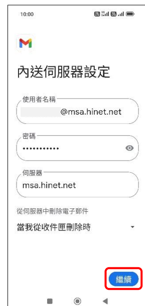
9.內送伺服器設定→繼續