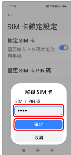
6. 輸入 SIM 卡 PIN 碼 → 確定