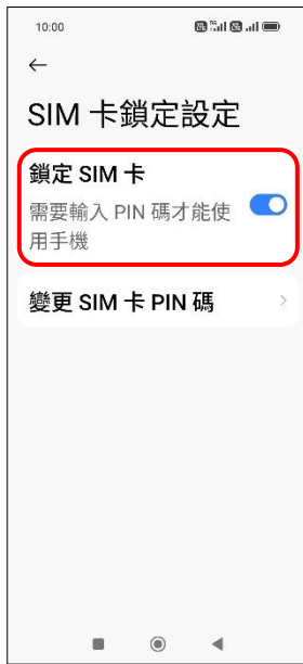
5. 鎖定 SIM 卡 → 關閉