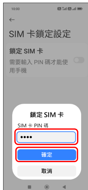
6. 輸入 SIM 卡 PIN 碼 → 確定