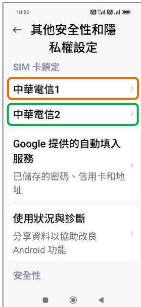
4. 選擇 SIM1/SIM2