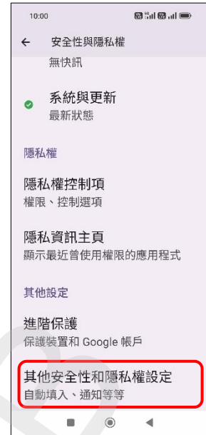
3. 其他安全性和 隱私權設定