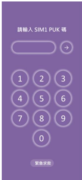
1. PIN 碼 3 次錯誤 顯示輸入 PUK 碼