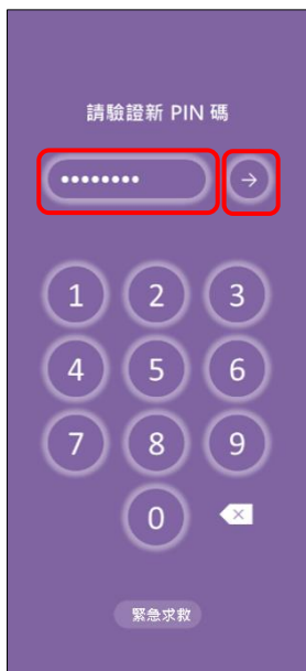
4. 請驗證新 PIN 碼 → 確認