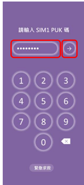
2. 輸入 8 位數 PUK 碼 → 確認