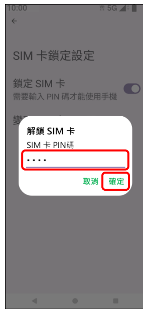
6. 輸入 SIM 卡 PIN 碼 → 確定