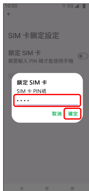
6.輸入 SIM 卡 PIN 碼 →確定