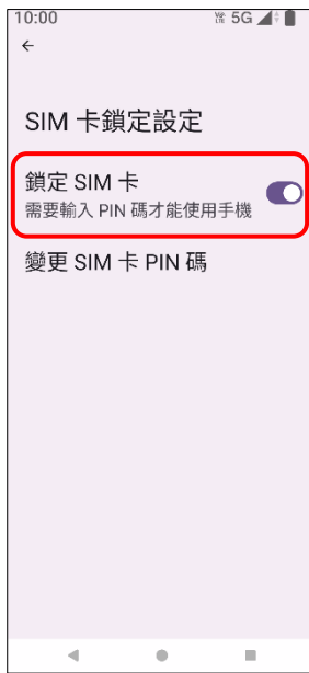
5. 鎖定 SIM 卡 → 關閉