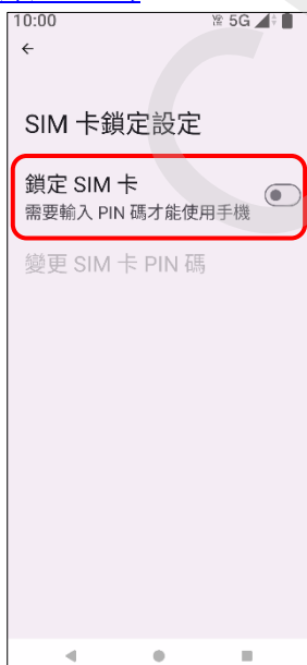
5.鎖定 SIM 卡→開啟