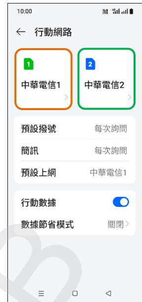
3. 選擇 SIM1/SIM2