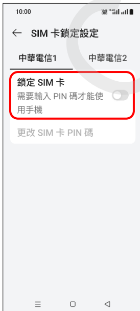
6. 鎖定 SIM 卡 → 開啟