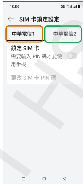
5. 選擇 SIM1/SIM2