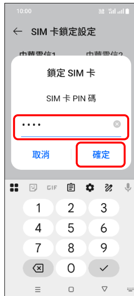
7. 輸入 SIM 卡 PIN 碼 → 確定