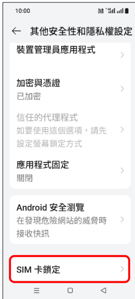
4. SIM 卡鎖定