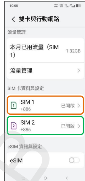
3. 選擇 SIM1/SIM2