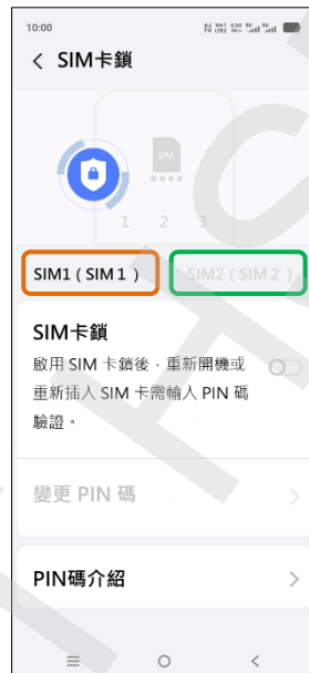
5. 選擇 SIM1/SIM2