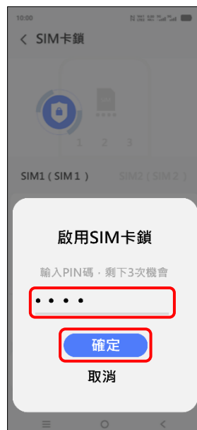
7. 輸入 PIN 碼→確定