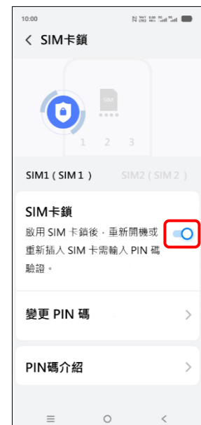
8. 完成 (啟用 PIN 碼驗證)