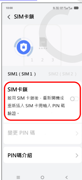
6. SIM 卡鎖→開啟