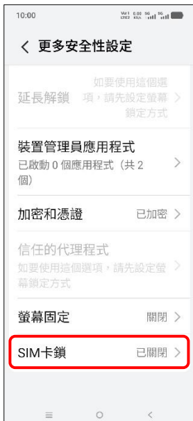
4. SIM 卡鎖