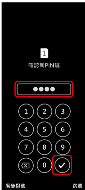
4. 確認新 PIN 碼 → ✓ 確定