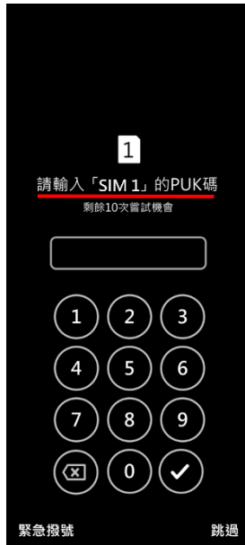
1. PIN 碼 3 次錯誤 顯示輸入 PUK 碼