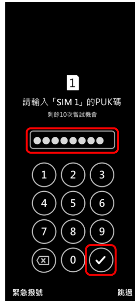
2. 輸入 8 位數 PUK 碼 → ✓ 確定