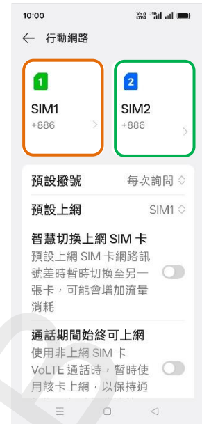
3. 選擇 SIM1/SIM2