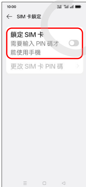
6. 鎖定 SIM 卡→開啟