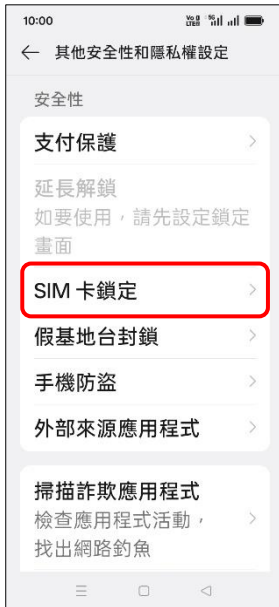
4. SIM 卡鎖定