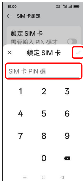
7. 輸入 SIM 卡 PIN 碼 → ✓ 確定