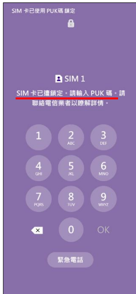
1.輸入 PIN 碼 3 次錯誤 顯示輸入 PUK 碼