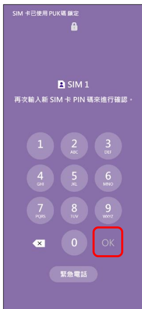
4.再次輸入新 SIM 卡 PIN 碼→OK