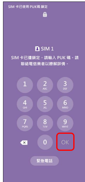
2.請輸入 8 位數 PUK 碼 →OK