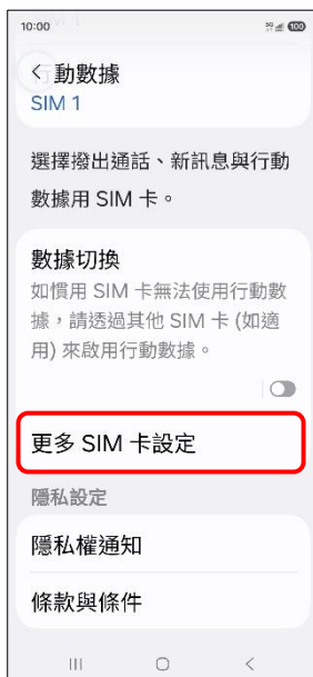
4.更多 SIM 卡設定