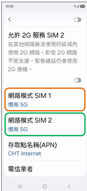
4.網路模式 SIM1/SIM2 (例：SIM1)