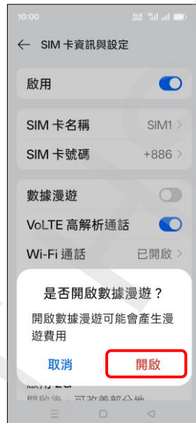
5. 提示說明 開啟