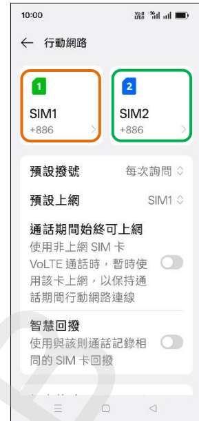
3. 選擇 SIM1/SIM2