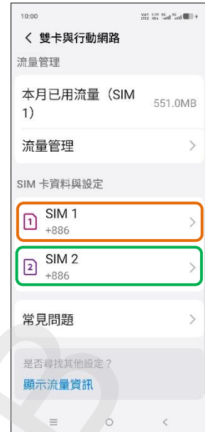
3. 選擇 SIM1/SIM2