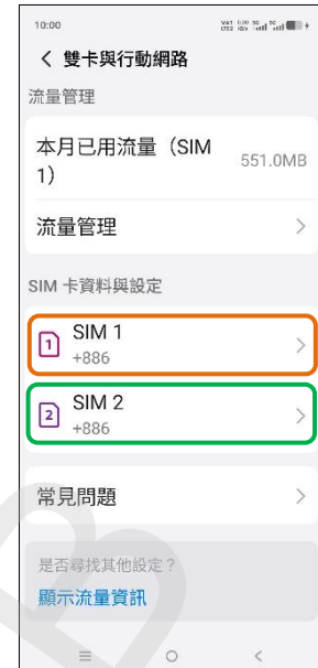
3. 選擇 SIM1/SIM2