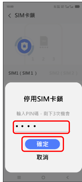
7. 輸入 PIN 碼 → 確定