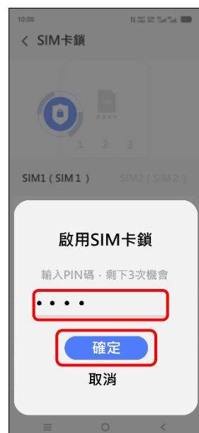
7. 輸入 PIN 碼→確定