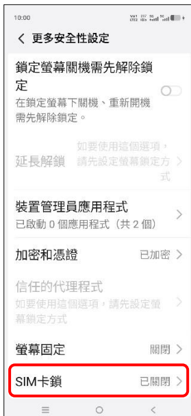
4. SIM 卡鎖