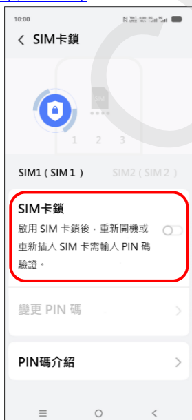
6. SIM 卡鎖→開啟