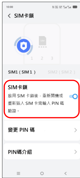
6. SIM 卡鎖 → 關閉