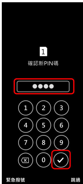
4. 確認新 PIN 碼 → ✓ 確定