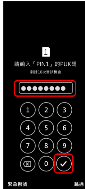
2. 輸入 8 位數 PUK 碼 → ✓ 確定