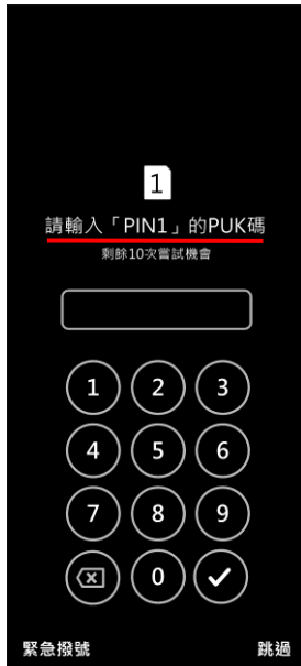
1. PIN 碼 3 次錯誤 顯示輸入 PUK 碼