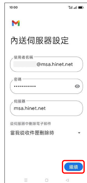
9.內送伺服器設定→繼續