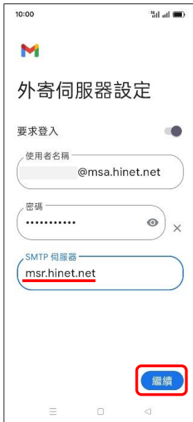
10.外寄伺服器設定 →繼續