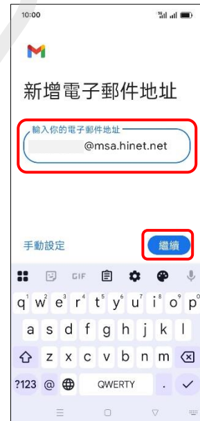
6.新增電子郵件地址 →繼續