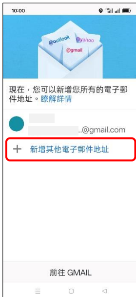
4.+ 新增其他電子郵件地址