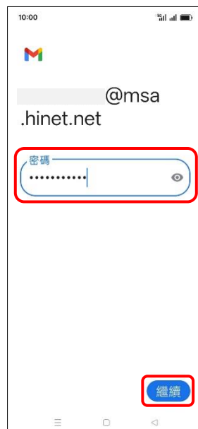
8.輸入郵件密碼→繼續