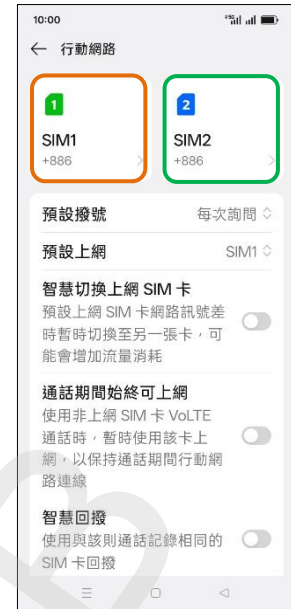
3. 選擇 SIM1/SIM2