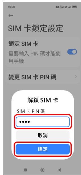
7. 輸入 SIM 卡 PIN 碼 → 確定