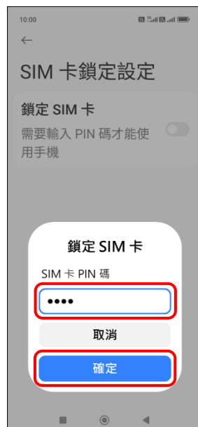
7. 輸入 SIM 卡 PIN 碼 → 確定