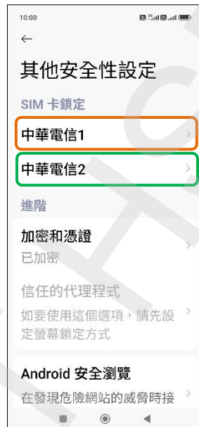
5. 選擇 SIM1/SIM2