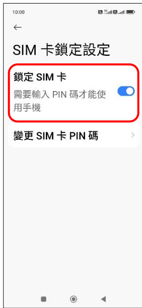
6. 鎖定 SIM 卡 → 關閉