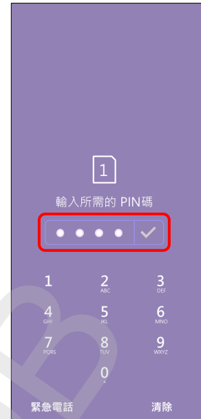
3. 輸入所需的 PIN 碼 → ✓ 確認