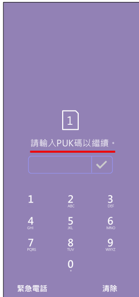
1. 輸入 PIN 碼 3 次錯誤 顯示輸入 PUK 碼