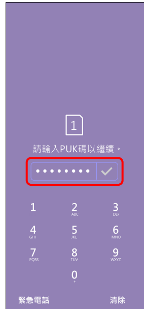
2. 請輸入 8 位數 PUK 碼 → ✓ 確認