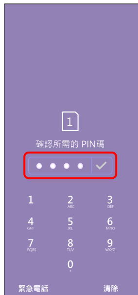
4. 確認所需的 PIN 碼 → ✓ 確認