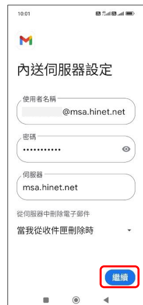
9.內送伺服器設定→繼續