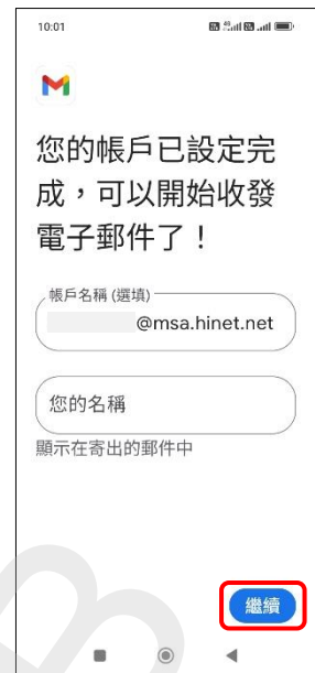
12. 自行設定 → 繼續