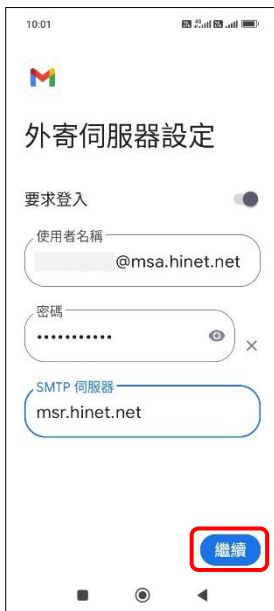
10. 外寄伺服器設定 → 繼續