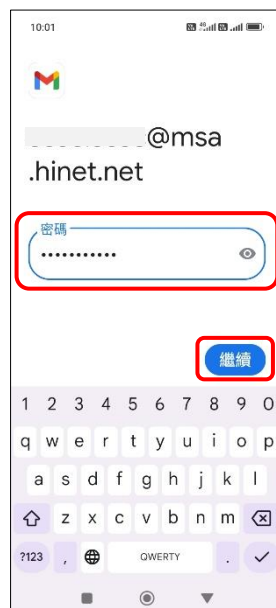
8.輸入郵件密碼→繼續