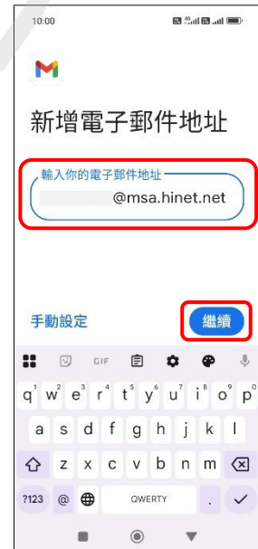
6.新增電子郵件地址 →繼續