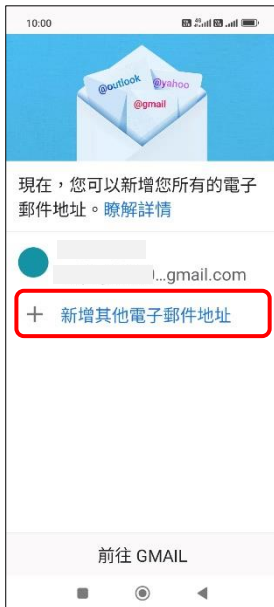
4.+ 新增其他電子郵件地址