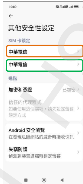
4. 選擇 SIM1/SIM2