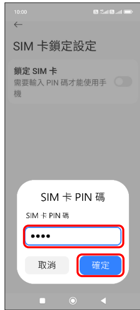
6. 輸入 SIM 卡 PIN 碼 → 確定