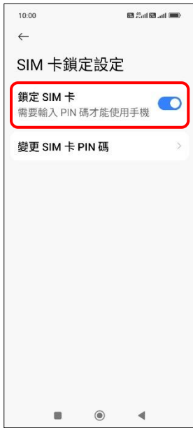
5. 鎖定 SIM 卡 → 關閉