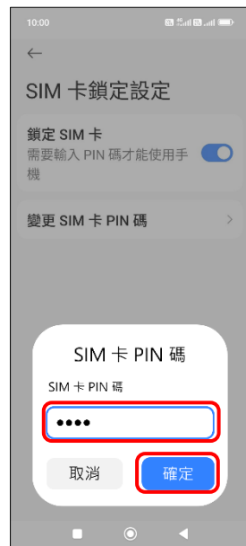
6. 輸入 SIM 卡 PIN 碼 → 確定