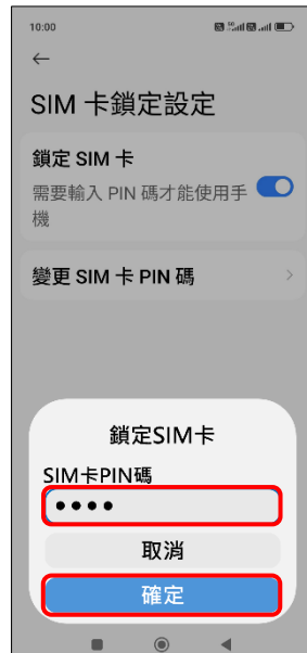
6. 輸入 SIM 卡 PIN 碼 →確定