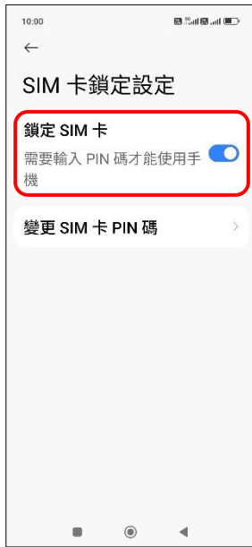
5. 鎖定 SIM 卡 → 關閉