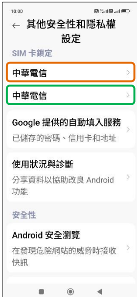
4. 選擇 SIM1/SIM2