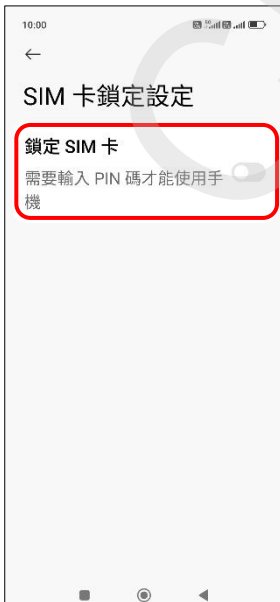
5. 鎖定 SIM 卡→開啟