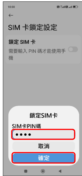
6. 輸入 SIM 卡 PIN 碼 → 確定