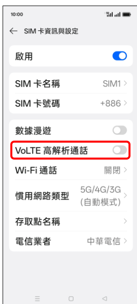
4.VoLTE 高解析通話 →開啟