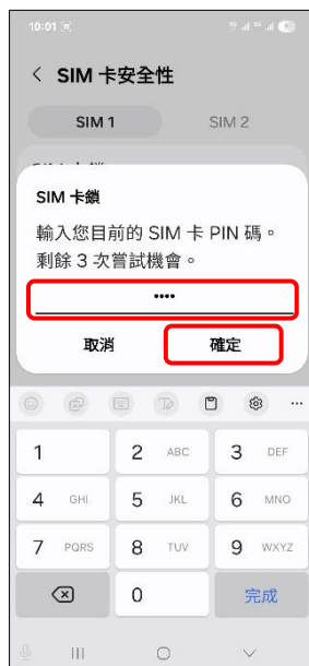
8.輸入您目前的 SIM 卡 PIN 碼→確定