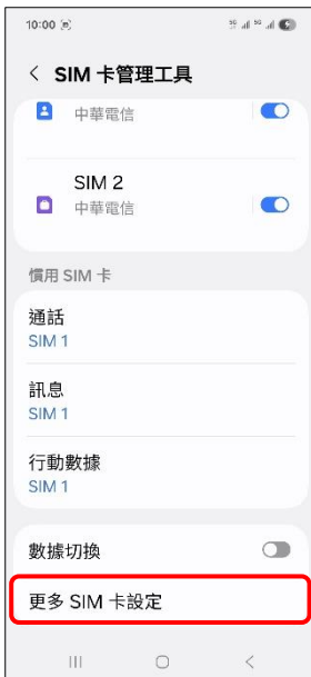
4.更多 SIM 卡設定