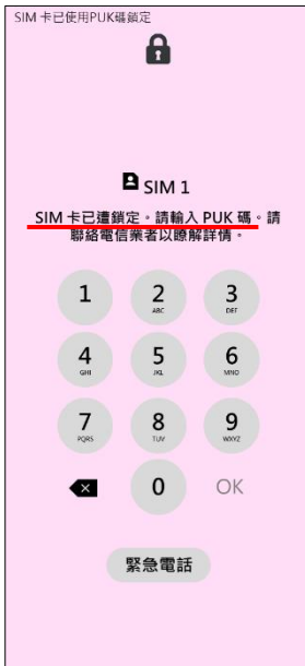
1. 輸入 PIN 碼 3 次錯誤 顯示輸入 PUK 碼