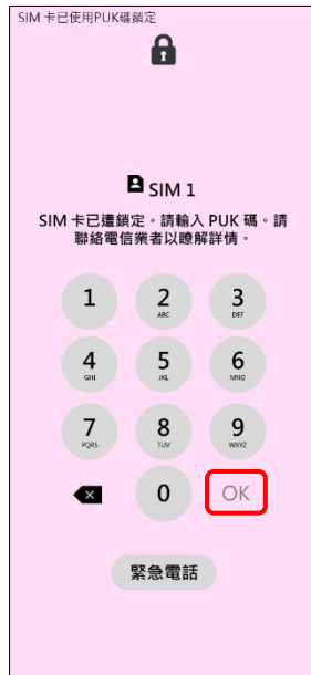
2. 請輸入 8 位數 PUK 碼 →OK