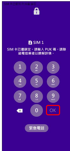
2.請輸入 8 位數 PUK 碼 →OK