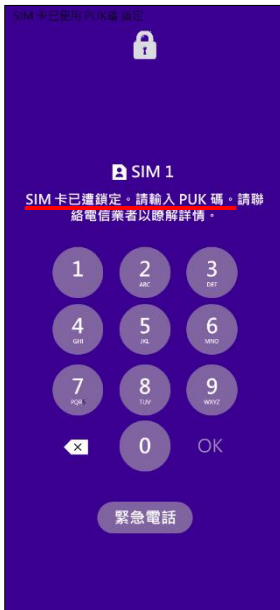
1.輸入 PIN 碼 3 次錯誤 顯示輸入 PUK 碼