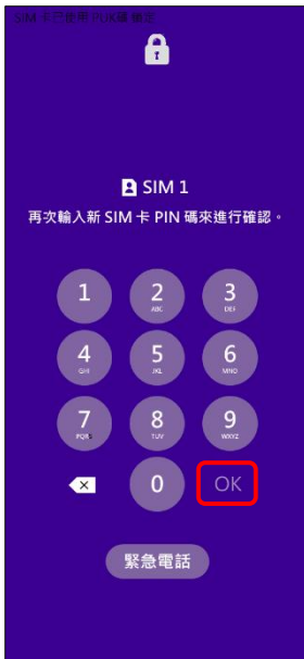
4.再次輸入新 SIM 卡 PIN 碼→OK