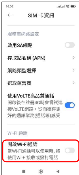
4. 開啟 Wi-Fi 通話 → 開啟