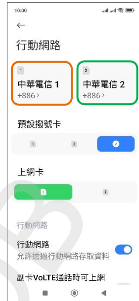
3. 選擇 SIM1/SIM2