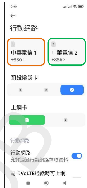
3. 選擇 SIM1/SIM2