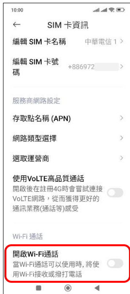
4. 開啟 Wi-Fi 通話 → 開啟