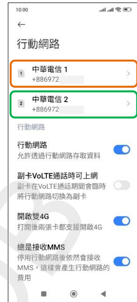
3. 選擇 SIM1/SIM2