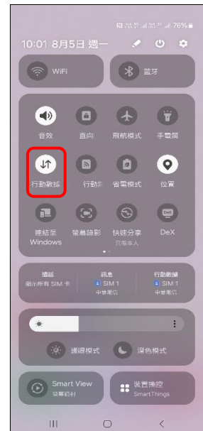
3.點 ⬆️ → 行動數據 關