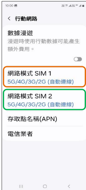
4.網路模式 SIM1/SIM2 (例: SIM1)