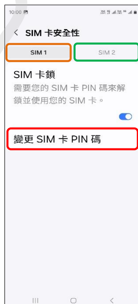
6.選擇 SIM1/SIM2 →變更 SIM 卡 PIN 碼