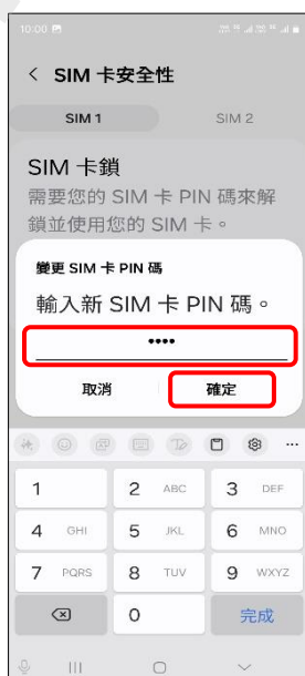
8.輸入新 SIM 卡 PIN 碼 →確定