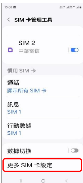
4.更多 SIM 卡設定