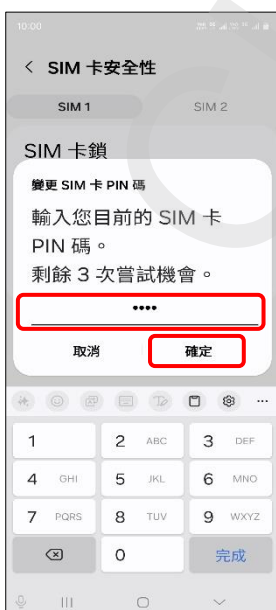
7.輸入您目前的 SIM 卡 PIN 碼→確定