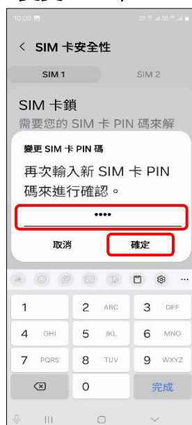
9.再次輸入新 SIM 卡 PIN 碼 →確定