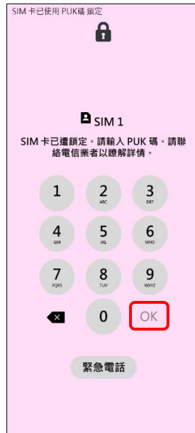
2. 請輸入 8 位數 PUK 碼 →OK