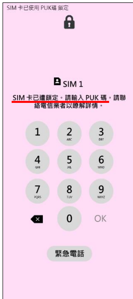
1. 輸入 PIN 碼 3 次錯誤 顯示輸入 PUK 碼