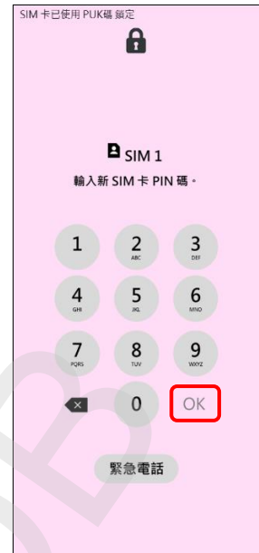
3. 輸入新 SIM 卡 PIN 碼 →OK