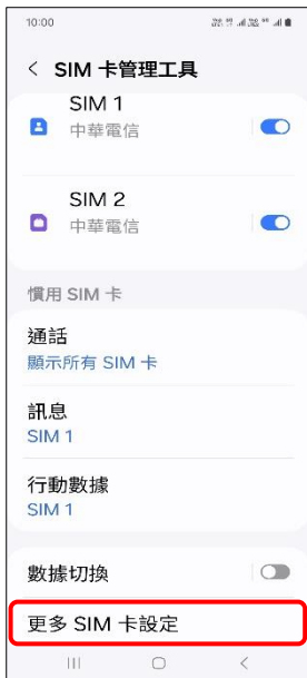
4.更多 SIM 卡設定