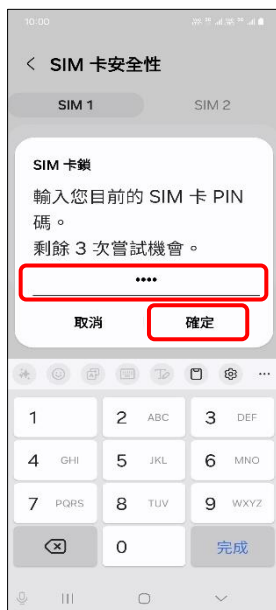
8.輸入您目前的 SIM 卡 PIN 碼→確定