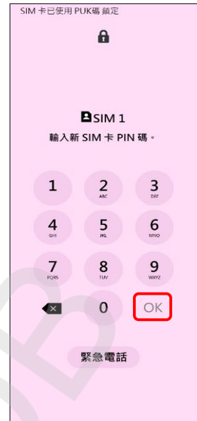
3. 輸入新 SIM 卡 PIN 碼 →OK