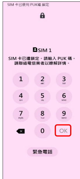
2. 請輸入 8 位數 PUK 碼 →OK