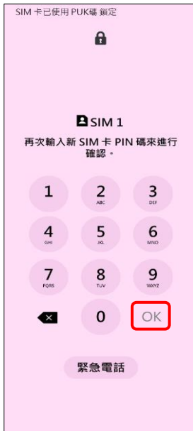
4. 再次輸入新 SIM 卡 PIN 碼 →OK