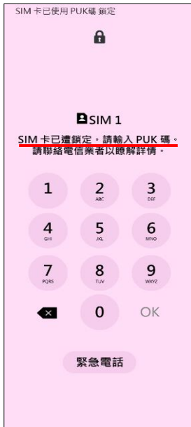
1. 輸入 PIN 碼 3 次錯誤 顯示輸入 PUK 碼