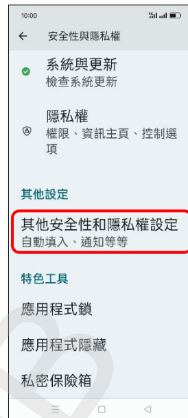
3. 其他安全性和 隱私權設定