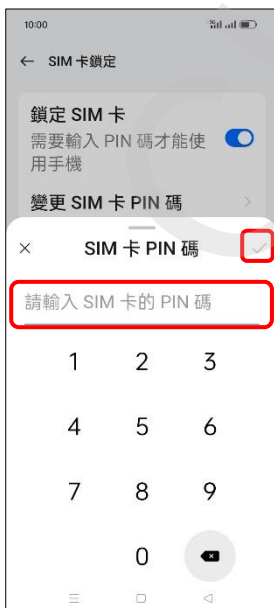
7. 輸入 SIM 卡的 PIN 碼 → (確定)