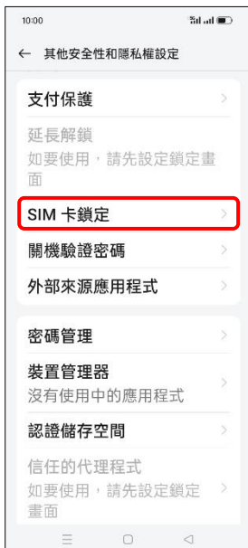
4. SIM 卡鎖定