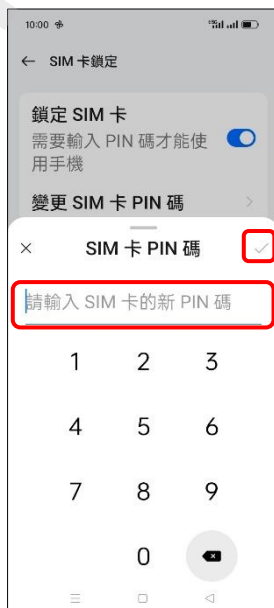
8. 輸入 SIM 卡的新 PIN 碼 → (確定)