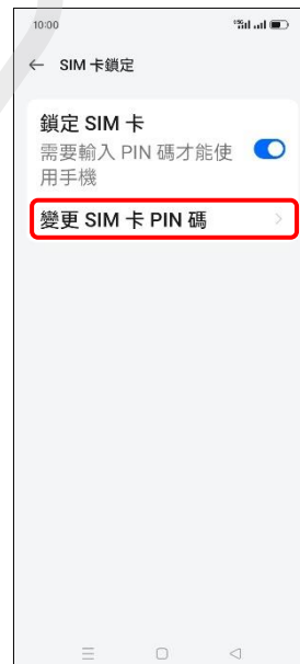
6. 變更 SIM 卡 PIN 碼