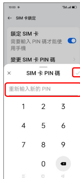
9. 重新輸入新的 PIN → (確定)