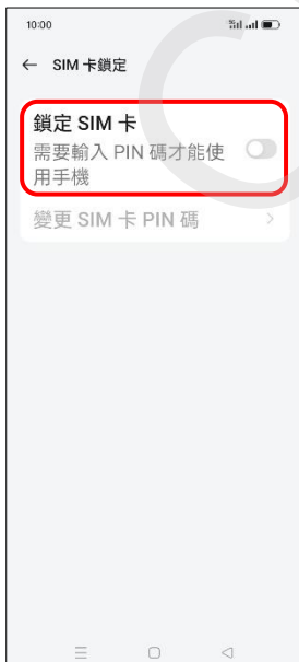
6. 鎖定 SIM 卡 → 開啟