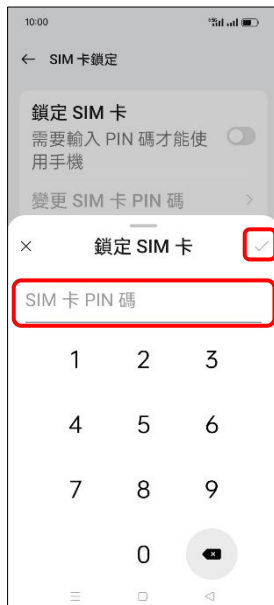
7. 輸入 SIM 卡 PIN 碼 → [ ] (確定)