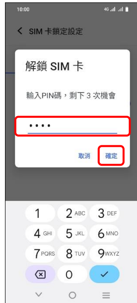
6. 輸入 PIN 碼 → 確定