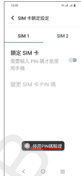
7. 完成 (停用 PIN 碼驗證)