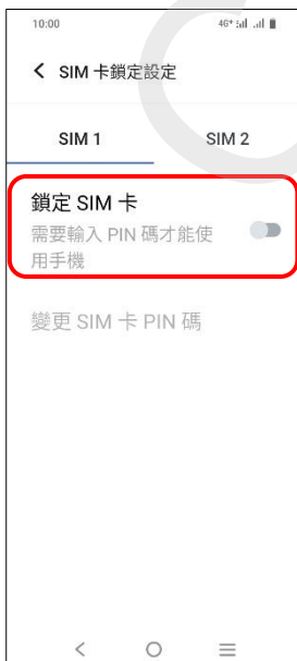
5.鎖定 SIM 卡→開啟