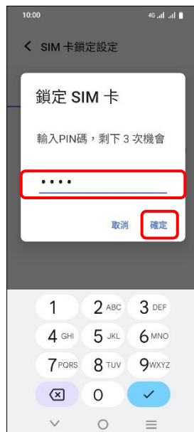
6.輸入 PIN 碼→確定