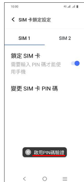
7.完成 (啟用 PIN 碼驗證)