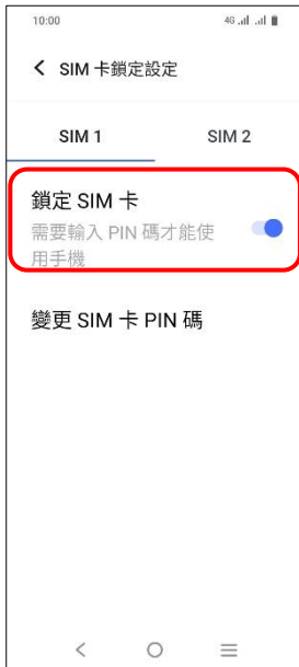
5. 鎖定 SIM 卡 → 關閉