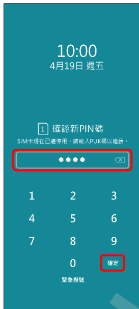
4. 確認新 PIN 碼 → 確定