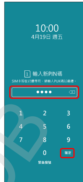
3. 輸入新 PIN 碼 → 確定