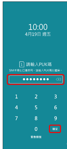
2. 輸入 8 位數 PUK 碼 → 確定