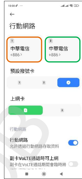
3. 選擇 SIM1/SIM2