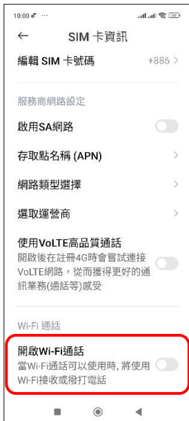
4. 開啟 Wi-Fi 通話 → 開啟