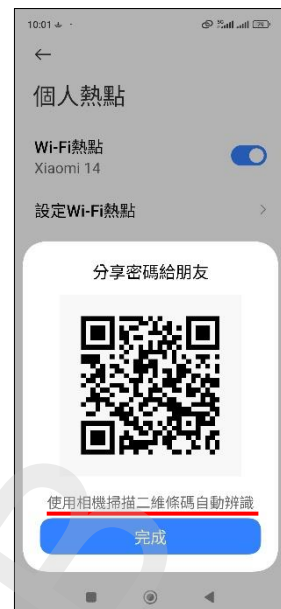
6. 掃描二維條碼自動辨識