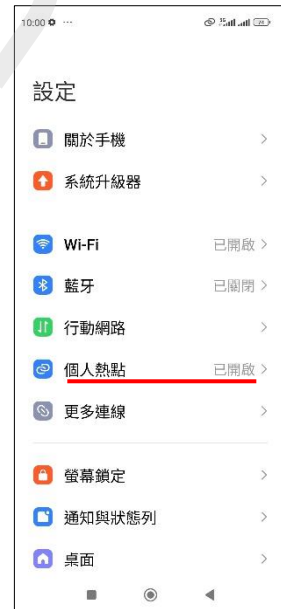
6.完成首次個人熱點開啟