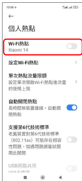
4. Wi-Fi 熱點 → 開啟