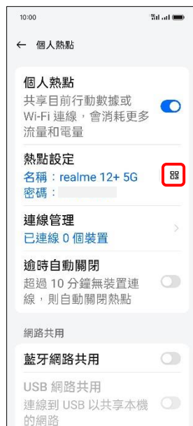
5.輕觸 QR 碼