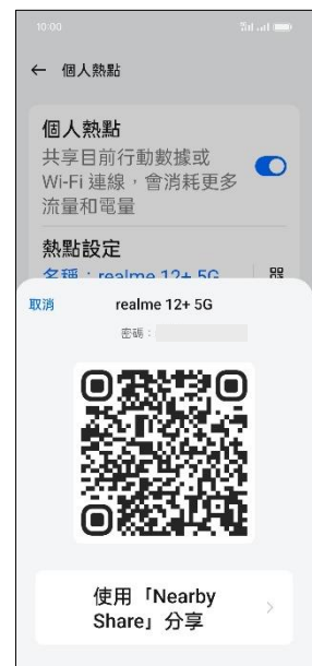
7.掃描 QR 碼即可連接