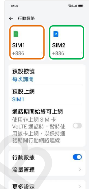
3. 選擇 SIM1/SIM2