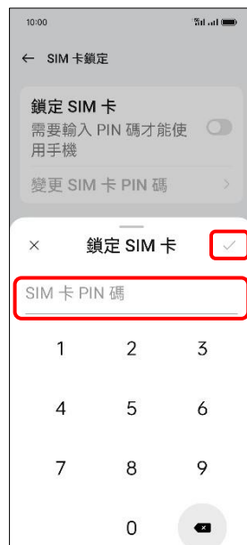
7. 輸入 SIM 卡 PIN 碼 → ✓ (確定)