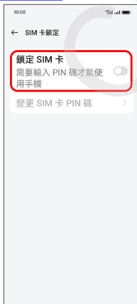
6. 鎖定 SIM 卡→開啟