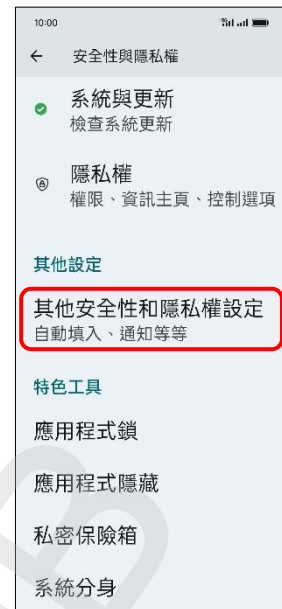
3. 其他安全性和 隱私權設定