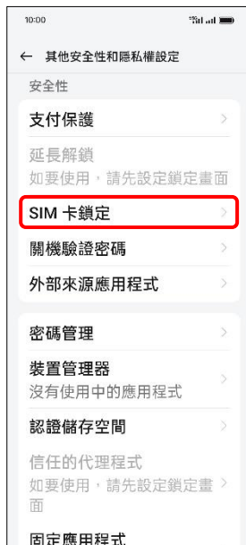
4. SIM 卡鎖定